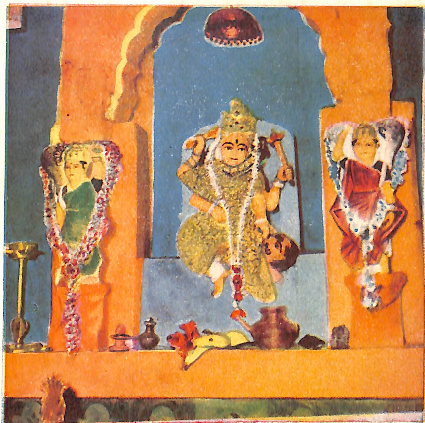
भगवती श्री पीताम्बरा बगला